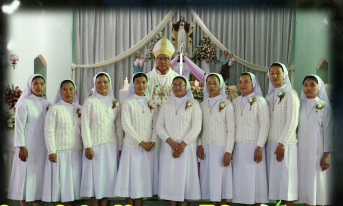
ခရစ်တော်၏ခေါ်သံနာခံခြင်း.. စာ(၁၅)