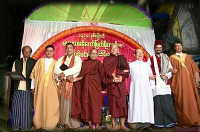
ဘာသာပေါင်းစုံဓမ္မသဘင် ..စာ(၁၂)