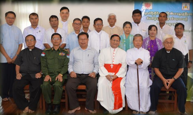
ဒေသဖွံ့ဖြိုးရေးဆွေးနွေးပွဲ...စာ (၉)