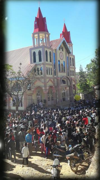
ဘုရားကျောင်းကောင်းချီးပေးပွဲ .. စာ(၁၉)